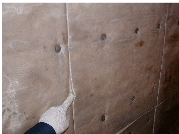
グラスウールの内部を見る