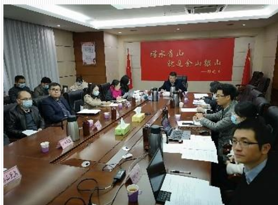
広東省生態環境庁（中国側会場）

この技術交流会は、中国において重点課題となっているオゾン汚染対策の一環として、オゾン生成の前駆体である揮発性有機化合物(VOC)の企業による排出削減を推進するために、広東省においてVOC排出削減を実施している優良企業の対策効果を紹介するとともに、日本の環境技術を広く中国に紹介し、VOC排出対策の高度化に寄与することを目的に開催され、中国の地方政府関係者及びVOC排出対策を実施する企業、日本の環境対策技術を有する企業関係者等40機関、100名以上が参加しました。