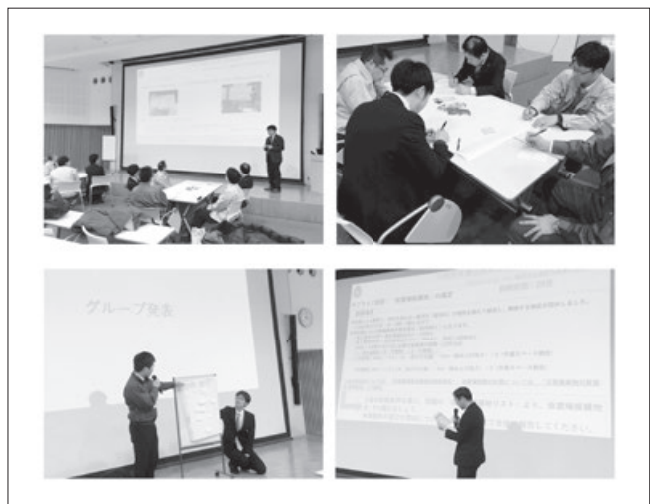
写真5 ワークショップ実施風景

害廃棄物処理人材の育成は、災害廃棄物処理計画の策定等と並んで、発災までに準備しておかなければならない非常に重要な取り組みであると切に感じている。しかしながら、小規模な自治体であると、マンパワー等の問題で処理計画策定まで手が回らない等様々な課題があるのも事実である。