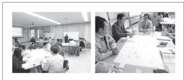
写真3 ワークショップ風景