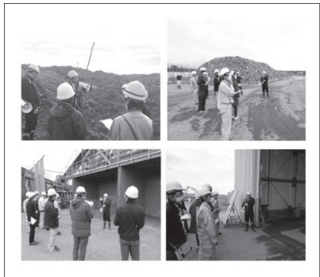
写真2 現地視察風景