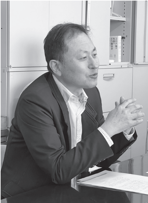
秦 水・大気環境局長

プラスチックを分別・回収していくとなれば、そこにきちんとした雇用が生まれます。子どもたちが処分場で危険と隣り合わせで分別をしている現状の改善も期待できます。