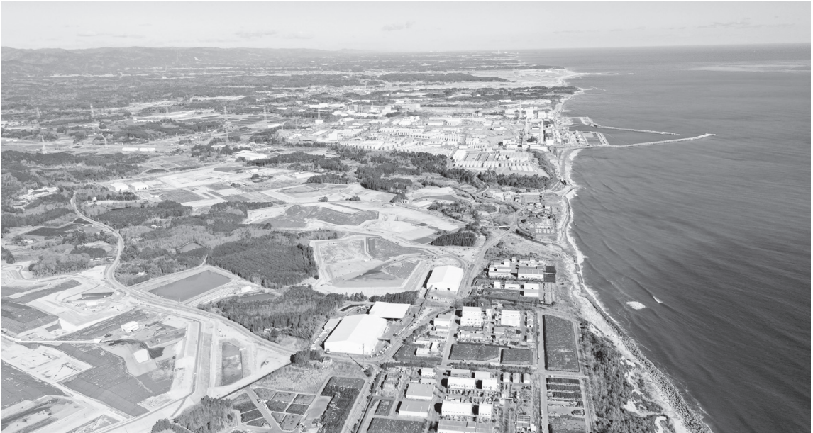
中間貯蔵施設の航空写真

中間貯蔵施設への搬入を完了したのですが、次はその土をどうするのか。今、チームの総力を挙げて対応していますけれども、大変重い課題です。