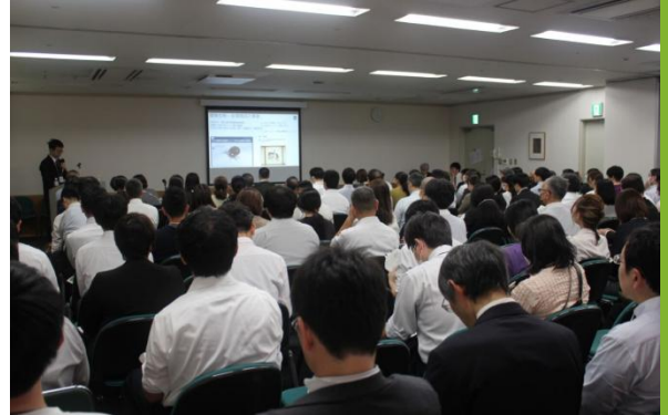
令和7年10月：環境衛生公開講座の様子