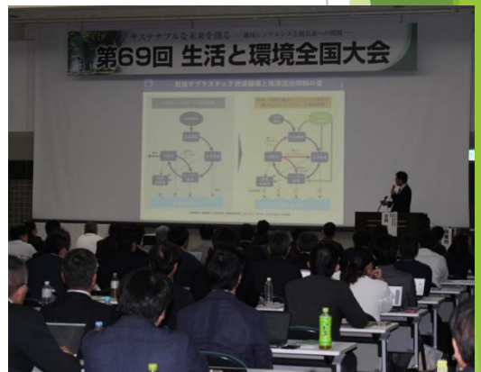
令和7年10月：廃棄物公開講座の様子